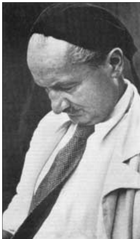
Den sene Heidegger.

Men det vigtige ved denne bog er, at den tager udgangspunkt i den senere Heidegger, der bevæger sig bort fra et nihilistisk fundament, forstået som traditionen, hvor mennesket har taget magten fra den traditionelt religiøse tradition. Heidegger begynder at interessere sig for et filosofisk religiøst aspekt som grundlag for en filoso-