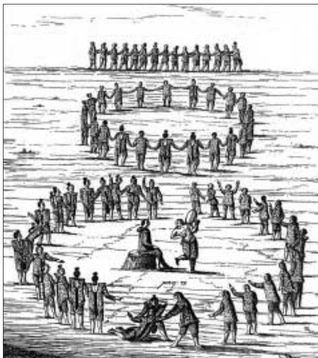
Illustration til kapitlet »Om grønlandernes lege og lystigheder« i Hans Egedes Perustration, 1741, genudgivet på Rhodos 1984.

»Og da jeg tænkte at være kommen der til Landet til dem, til deres Frelse og Salighed, er det just udfaldet til deres Undergang og Fordærvelse« (1738 s. 279).