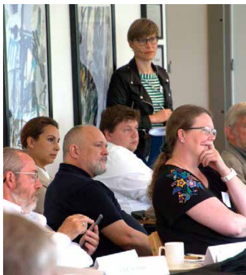
Repræsentantskabsmøde juni 2024

Vi bestræber os på nærhed til medlemmerne, høj tilgængelighed og klar tale om de politiske prioriteringer, som hovedbestyrelsen foretager.