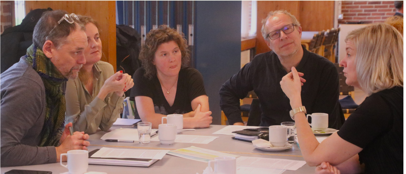
Gruppearbejde om Den gode kollega på TR mødet i Vallensbæk den 25. oktober