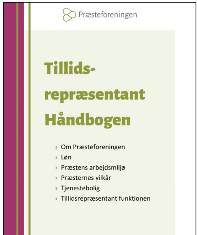
TR håndbogen 2023

Forventes udsendt i januar 2023 og vil blive lagt på foreningens hjemmeside.