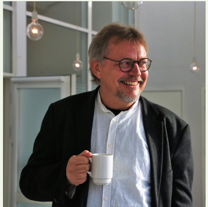
TR Thomas til TR-møde