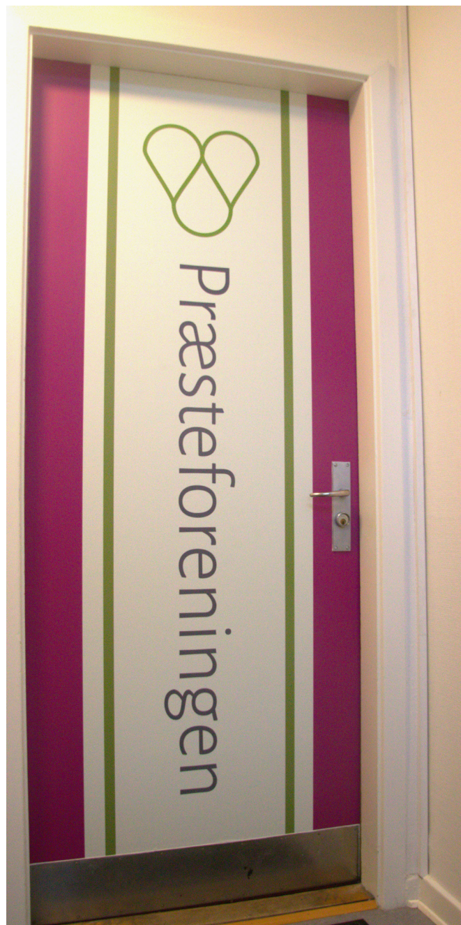
Præsteforeningens nye hoveddør på Rosenvængets Allé nr. 16, 3. sal, 2100 København Ø.

Hver forening deltager med repræsentation i en fire-årig periode og med forskudt start i forhold til den generelle udpegning fra Arbejdsmiljørådet.